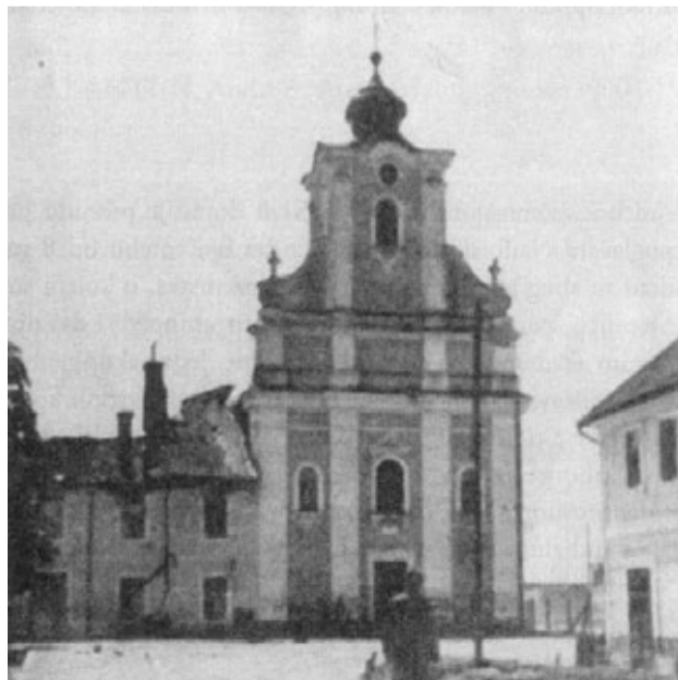
● Stara župna crkva u Staroj Gradiški koju su zatočeni svećenici morali srušiti