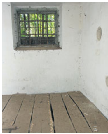
● U samice, u kojima su zatočnici sustavno slamani fizički i psihički, bili su bačeni i brojni svećenici

161. Serafino Matello , Luigija i Delfine r. Dini, rođen 20. 7. 1889. u mjestu Cornado di Vicentina, pro-