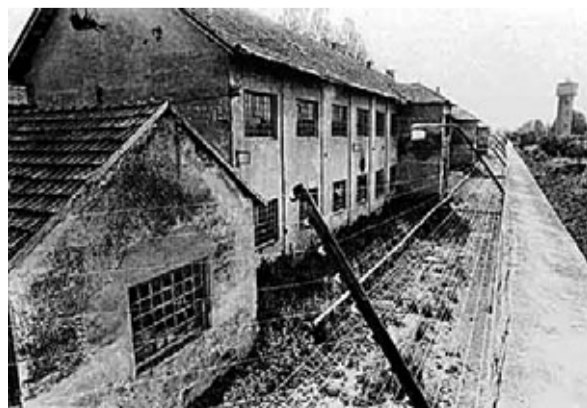
● U starogradiškom zatvoru stradalo je među ostalima jedanaest katoličkih svećenika

Uz priznanje da je bio tematski inovativan pisac, poglavito kad je riječ o temama iz našega iseljeničtva, stoji i to da nije uvijek dovoljno pazio na stil i psihološku produbljenost odnosno uvjerljivost likova. Tako bi sažeto mogao biti orisan Kovačevićev opus, kojega je novelistički dio nedvojbeno bolji od romanesknog. Nema međutim dvojbe o njegovim zaslugama za razvoj katoličke proze, prije svega u smislu proširenja njezinih tematskih obzora. ■