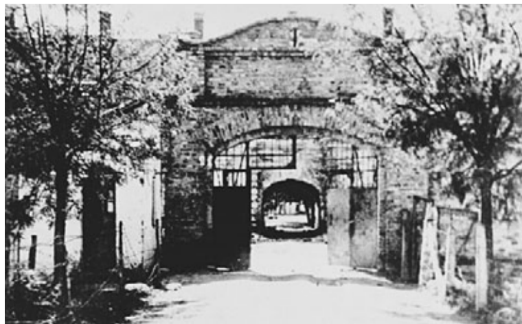
● Ulaz u starogradiški zatvor