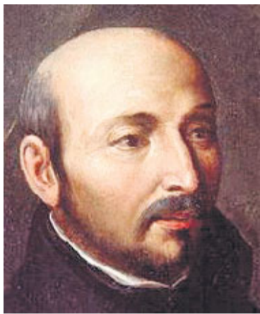
● Utemeljitelj isusovačkog reda sv. Ignacije Lojolski hrvatskom i svjetskom velikanu o. Boškoviću bio je vrelo, uzor i inspiracija u duhovnom, redovničkom i znanstvenom životu

U Bassanu se nastanio u Remondinijevu ljetnikovcu. Tu je izdao neka svoja djela u pet svezaka, koja se sastojala od znanstvenih rasprava koja su se odnosila samo na egzaktne znanosti. Kad je s tim poslom završio, odlučio je, već kao starac kojemu je tada bilo 74 godine, proći Italijom kako bi posjetio svoje znanice i prijatelje. Na tom putu su ga pratili tajnik Luigi Tomagnino i podvornik. Posjetio je Veneciju i Rim a i druga mjesta po Italiji te se