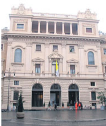
● Rimski kolegij u kojemu se o. Bošković proslavio kao ekspert u mehanici, optici, astronomiji, matematici, graditeljstvu, filozofiji i pjesništvu, ali i bio poznat kao mistik

U Beču je, 1758. godine, Bošković dovršio svoje veliko, zapravo